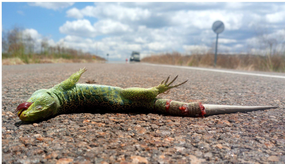
Lagarto Ocelado atropellado en la SG-500.

"En el periodo entre 2016 y 2019 y en un tramo de 13 km objeto de nuestro estudio se ha realizado un seguimiento de la comunidad de fauna y su mortalidad en la carretera SG-500 que vertebraba la comarca de Campo Azálvaro (n atropellos= 145), con una evaluación anual que muestra una clara tendencia al alza, cabe indicar (n atropellos= 19/2016; n atropellos= 48/2017). Estos datos han si-